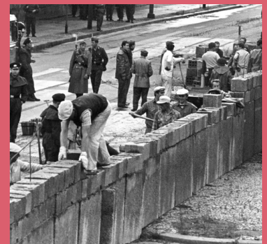
Bouw Berlijnse Muur