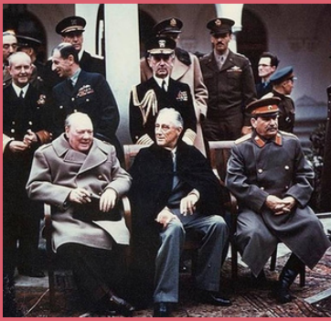
Conferentie van Jalta/Potsdam