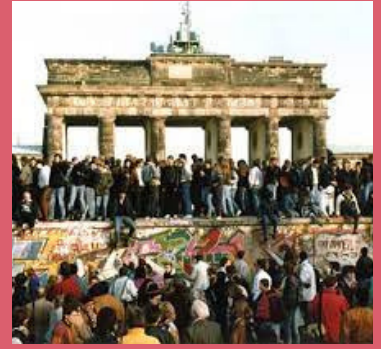
Val Berlijnse Muur