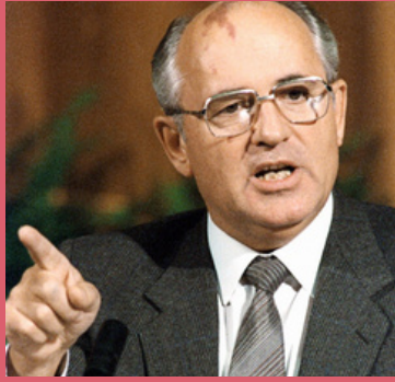
Perestrojka en glasnost