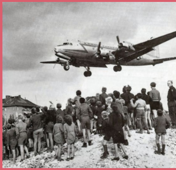
Blokkade van Berlijn