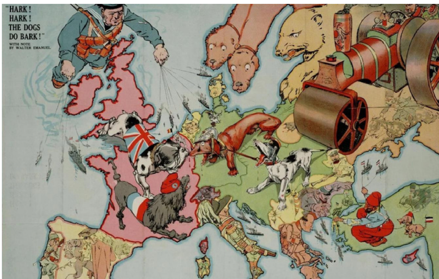
Hark! Hark! The Dogs Do Bark! (1914)

OPDRACHT: SOM ALLE OORZAKEN VAN DE EERSTE WERELDOORLOG OP EN NOTEER HIER DE BETEKENIS BIJ